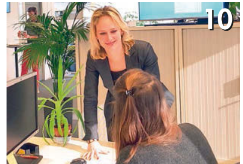
Vertrouwen geven is vertrouwen ontvangen